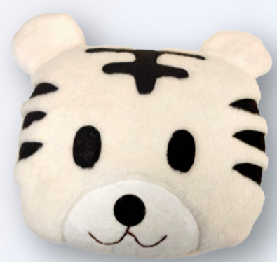
非賣品 SA803 如意虎