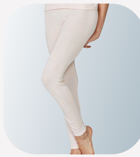
UW312 新雅緻仕女長內褲