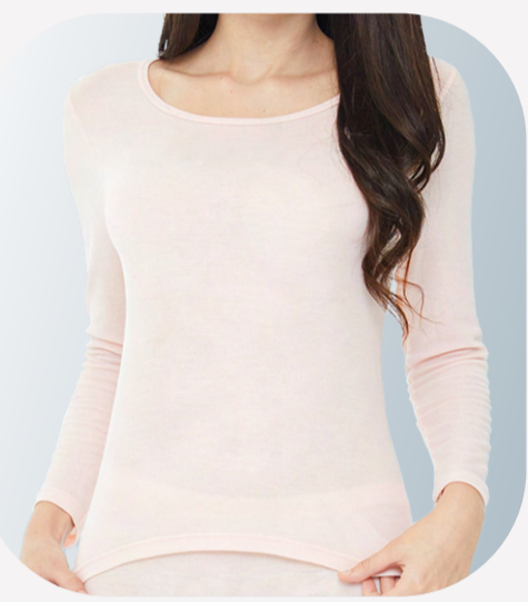
UW315 新雅緻仕女長袖內衣