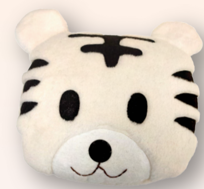
非賣品 SA803 如意虎