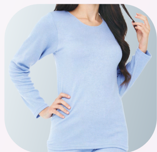
UW201 舒柔女仕長袖內衣