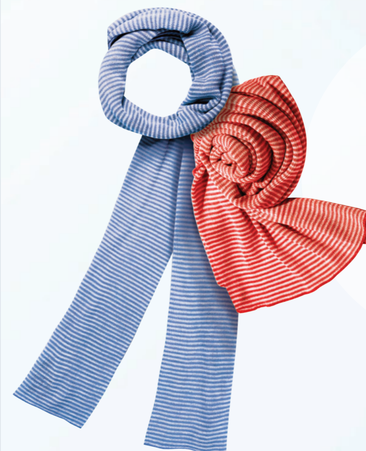
AS004 風采條紋圍巾 - 180 x 38cm (亮紅 x 白色 或 寶藍 x 白色)