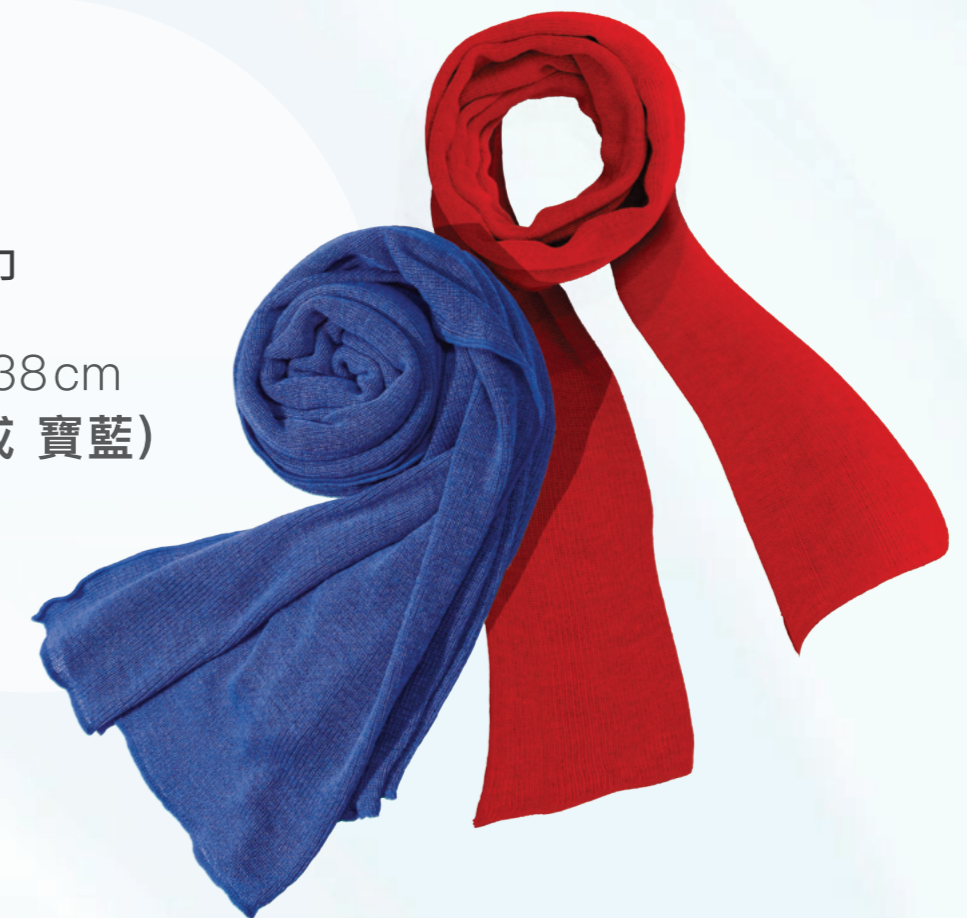
AS003 風采圍巾 - 180 x 38cm (亮紅 或 寶藍)