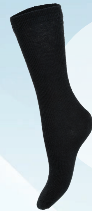
LS004 妮美龍長襪 - 黑色， 24 - 26cm