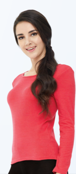
UW622 新仕女背心 - 紅色