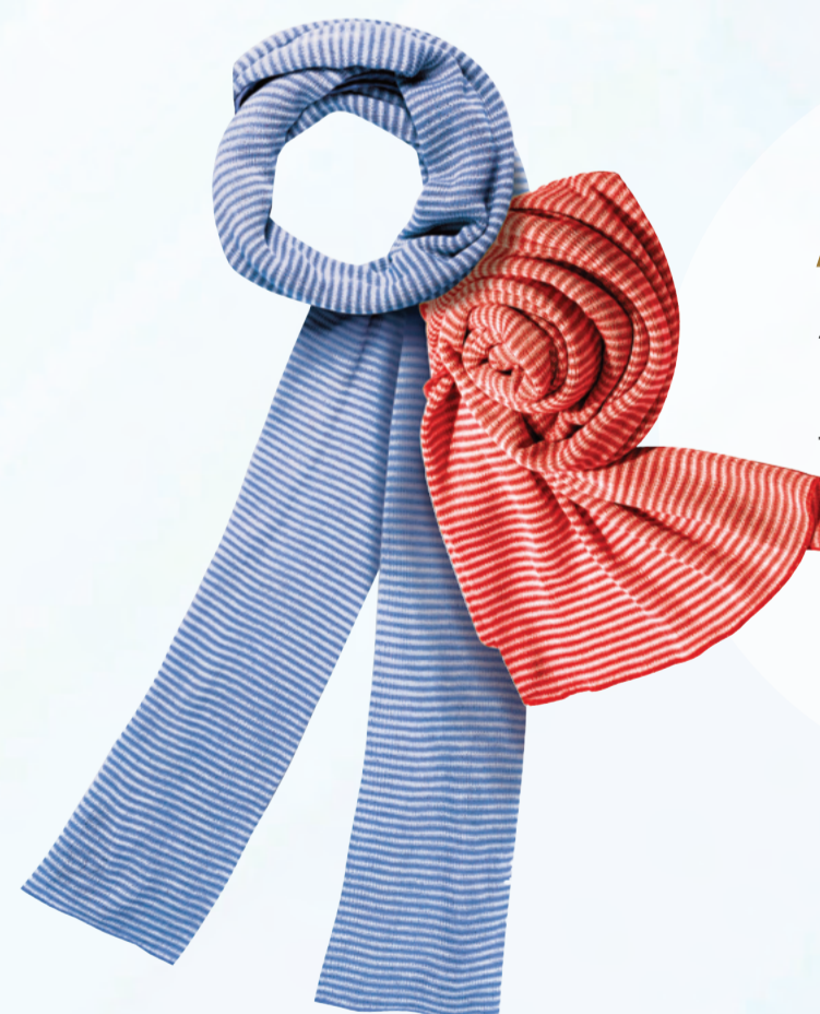
AS004 風采條紋圍巾 - 180 x 38cm (亮紅 x 白色 或 寶藍 x 白色)