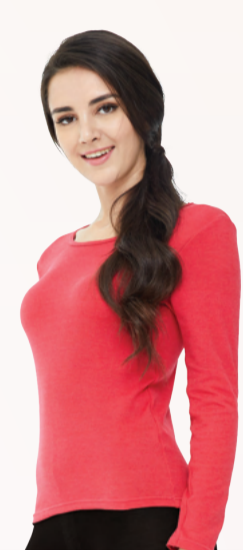
UW623 新仕女長袖上衣 - 紅色