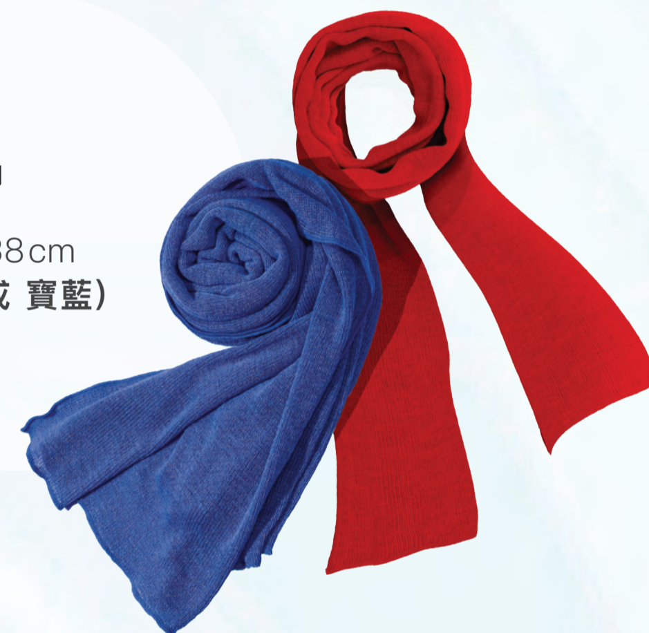
AS003 風采圍巾 - 180 x 38cm (亮紅 或 寶藍)