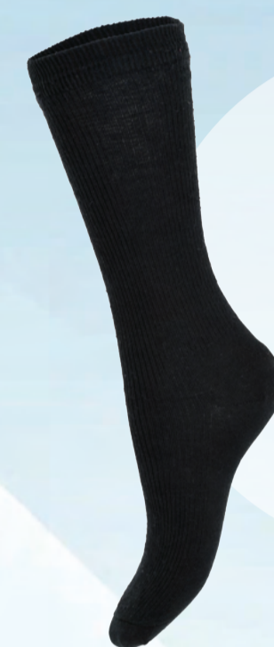
LS004 妮美龍長襪 - 黑色， 24 - 26cm