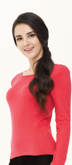
UW623 新仕女長袖上衣 - 紅色